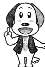
コスモスおおさか イメージキャラクター 成年後犬 さぼ太くん

公益社団法人 コスモス成年後見サポートセンター大阪府支部 大阪府中央区南新町1丁目3番7号 大阪府行政書士会館内 TEL 06-6943-7517 URL https://cosmos-osaka.com/